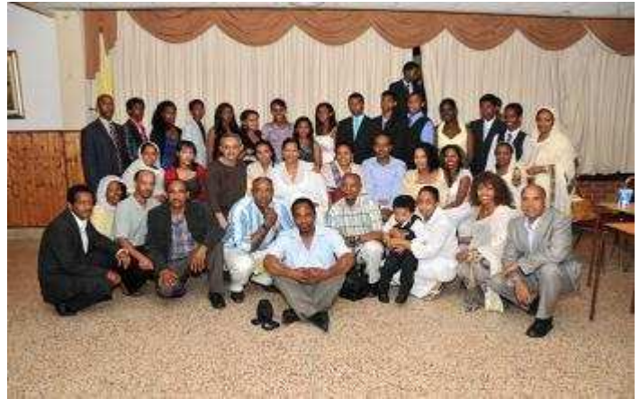
ገለ ካብቲ ኣብ በዓል ማርያም ደዓሪት ዝተወሰደ