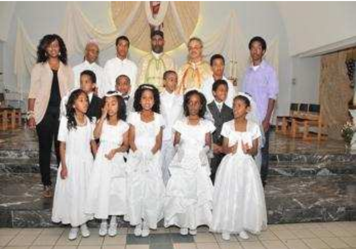
ብግንቦት 2011 ናይ መጀመርያ ቅዱስ ቁርባን ዝተቐበሉ ህጻናት ምስ መማህራኖም

ምእመናን ብባህላዊ መግብታትን፣ መስተን ፣ ብዋዛን ቁምነገርን ተሰንዮም ክዘናግዑ ድሕሪ ምውዓል አማሲያኡ እቲ በዓል ተዛዘመ። ብኑሐስ 22 ድማ በዓል ፍልሰታ ማርያም ከቢሩ ውዲሉ። እቲ በዓል ሽሕጻ ሰኑይ፣ አብ ናይ ስራሕ መዓልቲ ይውዓል እምበር፣ ትጽቢት ካብ ዝተገረሉ ህዝቢ ንላዕሊ አብ ቅዳሴ ተሳቲፉ።