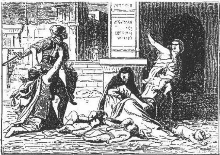
The Holy Innocents.

ሣልሱቲ ድሕሪ በዓል ልደት፡ ቤተክርስቲያን ነቶም ንጉሥ ሂሮድስ፡ ኢየሱስ ምስ ዓበዩ መንግሥጣቲ ካብኡ ወይ ካብ ደቁ ከይዝርፍ ፈሪሑን፡ ሰብኣ ሰገል ክንዲ ዝተላገጹሉ ተናዲዱን ዘቕተሎም ሕጻናት ቤተልሔም ትዝክር። ትጽቢቱ ኣብ ምንጎ እቶም ሕጻናት ኢየሱስ ኪልከም፡ ኣብ ንግስነቱ ዚወዳደር ከይርከብ ኢዩ ነይሩ፡ እንተኾነ - ወንጌል ማቴዎስ ከምዜዘንትወልና - ዮሴፍ፡ መልኣኽ ብሕልሚ ስለዝመኸሮ፡ ንኢየሱስን ማርያምን ናብ ግብጺ ኸዊሉዎም ስለዝጸንሑ፡ ሓሳብ ሂሮድስ ከይተዓወተ ተረፈ። ኢየሱስ ገና ኣብ ግብጺ እንከሎ፡ ሂሮድስ ሞተ፡ ኢየሱስ ድማ ብሰላም ንዓዱ ኪምለስ ከኣለ። ኸሕ እኳ እዚ ዛንታ ብዘይካ ኣብ ወንጌል ማቴዎስ ካልእ ታሪኻዊ ምስክርነት እንተዘይረኸበ ( ብሃዕባ ሕጻንነት ጎ. ኢየሱስ ክርስቶስ ተገዲሱን ተመራሚሩን ካብቶም ካልኣት ወንጌላውያን ከኣ ኣስፊሑን ዝጸሓፈ ሉቃስ ከይተረፈ ኣየዘንትዎን። ከምኡ ዮሴፍ ፍላጻኹ፡ ዚበሃል ምሁር ኣይሁዳዊ፡ ጸሓፍ ታሪኽ እስራኤል ክነሱን፡ ምስ ሂሮድስ ብዝነበሮ ብርቱዕ ኣንጻርነት፡ ግብሪ ክፍኣት ሂሮድስ ዘየሕልፈሉ፡ ነዚ ነጥቢ ኣብ "መጽሓፍ ዛንታ ዓለም" ዘርእሱቱ ድርሰቱ ኣየልዕሎን)፡ ሂሮድስ ብጭካኔኡ ወሩይ ስለዝነበረ፡ ምቕታል ሕጻናት ሓዲስ ነገር ኣይምኸኖን ነይሩ። 10 ኣንስቱ ኣእቲዩ 3 ካብእተን ተቐቲለን ሞታ፡ ከምኡ ካብ ደቁን ብዙሓት ቤተሰቡን ቀቲሉ። እዚ ድማ መንግሥቱ ከየሕድግዎ ኢሉ ብዘሓደሮ ፍርሕን ጥርጠራን ጥራሕ ኢዩ። ንጉሥ ሮማ ኣውጉስጦስ ባዕሉ፡ "ካብ ወላድ (ብግሪኽ HUIOS) ሂሮድስ፡ ሓሰማኡ (ብግሪኽ HUS) ሓለፋ ውሕስነት ኣለወን" ብምባሉ፡ ጭካኔ ሂሮድስ ክሳዕ ክንደይ ፍሉጥ ከምዝነበረ ይገልጻልና።